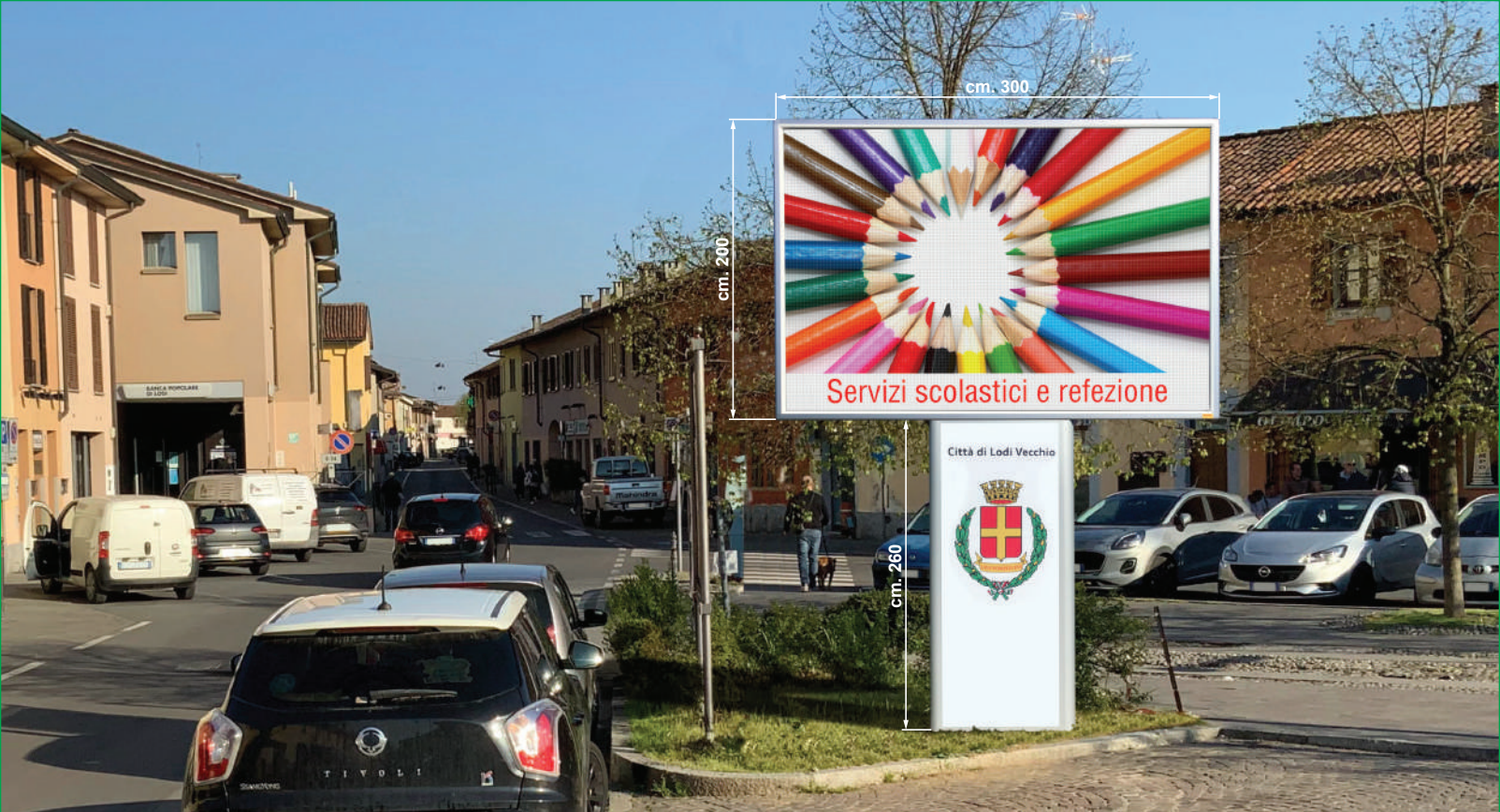
Led cm. 300x200 - Piazza Vittorio Emanuele II, Lodi Vecchio